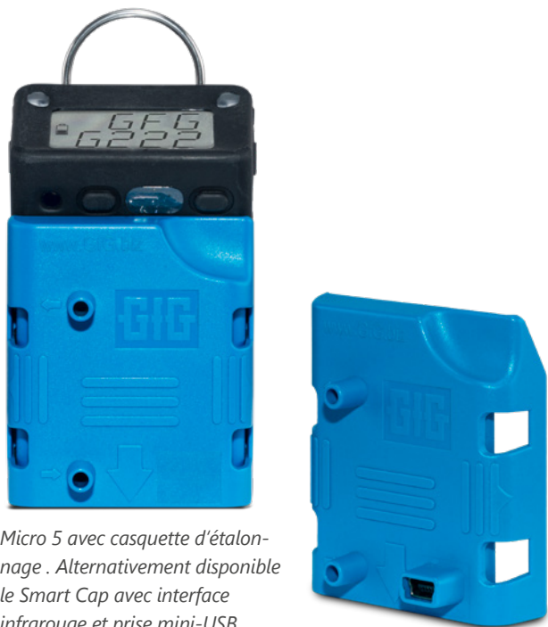
Micro 5 avec casquette d'étalonnage. Alternativement disponible le Smart Cap avec interface infrarouge et prise mini-USB.

Si vous souhaitez lire le contenu de l'enregistreur de données, vous aurez besoin à la place du Smart Cap, d'un câble de connexion USB et du logiciel de configuration pour la série G222.