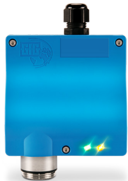
ZD22 met één kabelinvoer voor analoge aansluiting

In combinatie met de krachtige controllers van GfG zijn beide varianten de juiste keuze voor zuurstofbewaking op lange termijn.