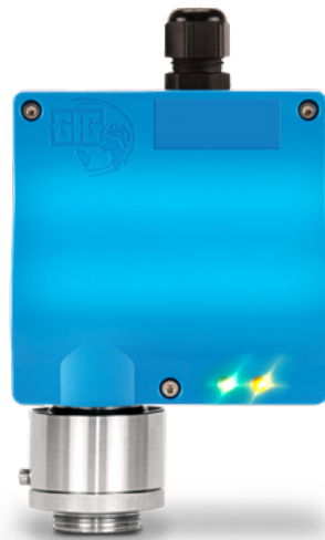
Analoge variant van de EC22 O met één kabelgang

De compacte behuizing voor wandmontage is beschermd tegen spatwater en stof (IP54). Aan de voorzijde van de EC22 O bevinden zich twee status-LED's. De groene led geeft aan dat het apparaat bedrijfsklaar is, de gele led geeft storingen of speciale toestanden aan.