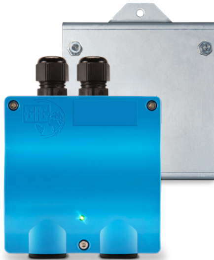
EC22 DS avec plaque de montage adaptée

Le transmetteur EC22 DS à double capteurs est conçu pour assurer une surveillance fiable et économique de ces gaz. En fonction de la pollution de l'air intérieur attendue, il est disponible dans les combinaisons de capteurs CO/NO et CO/NO 2 .