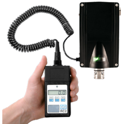
CC28 met RC2 afstandsbediening

Sommige brandbare gassen, zoals methaan, waterstof en ammoniak, zijn lichter dan lucht. Transmitters met dergelijke senso-