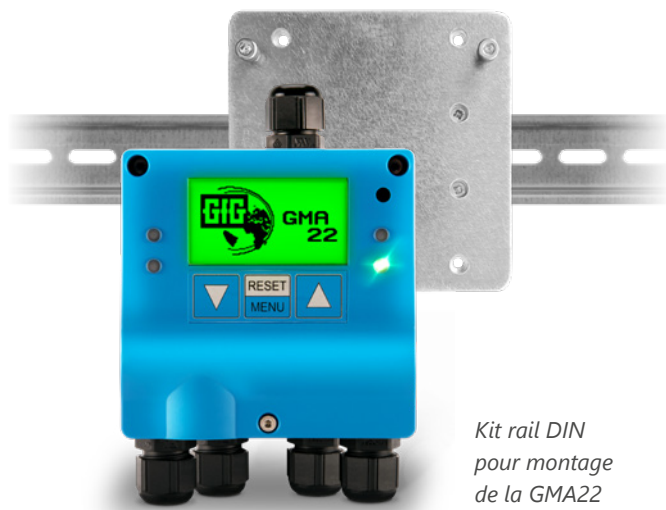
Kit rail DIN pour montage de la GMA22

L'option d'adresser non seulement les transmetteurs, mais aussi jusqu'à 4 modules relais supplémentaires de type GMA200-RT ou GMA200-RTD via l'interface numérique RS485 offre encore plus de flexibilité.