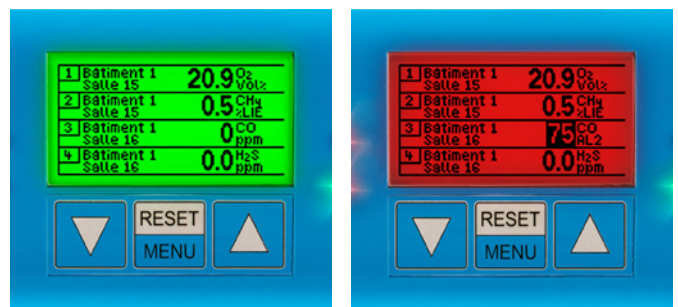
Aperçu des valeurs mesurées en état normal ou en état d'alarme

Les valeurs de mesure actuelles de tous les transmetteurs sont affichées en continu sur l'écran LCD 2,2". L'état de fonctionnement est indiqué par les LED d'état. En fonctionnement normal, seule la LED verte est allumée. Une LED jaune indique les dysfonctionnements ou les travaux de maintenance. En cas d'alarme, la couleur de fond de l'écran passe du vert au rouge et seules les valeurs mesurées aux points de mesure où les valeurs limites ont été dépassées ou non atteintes sont affichées. Des LED rouges indiquent le niveau d'alerte. De plus, un signal d'avertissement sonore retentit.