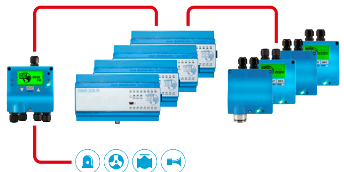
Configuration maximale GMA22

ACDC (Analog Carrier for Digital Communication) est une technologie brevetée de GfG. Elle permet à un transmetteur analogique de communiquer avec un contrôleur via une ligne 4-20 mA de la même manière qu'un transmetteur numérique via une connexion bus. Cela permet par exemple de calibrer à distance un transmetteur analogique. La condition préalable est toutefois que les deux appareils soient compatibles avec ACDC.